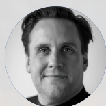
LOUIS MEISEN We Design Food